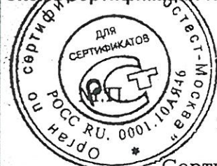
Схема сертификации № 3